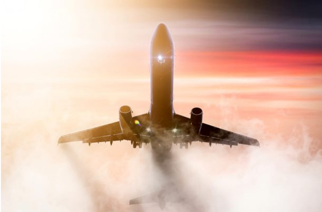
התעופה הבין-לאומית הייתה הגורם המרכזי לפליטות של פחמן דו-חמצני, והן הוערכו ב-665 מיליון טונות בשנת 2018