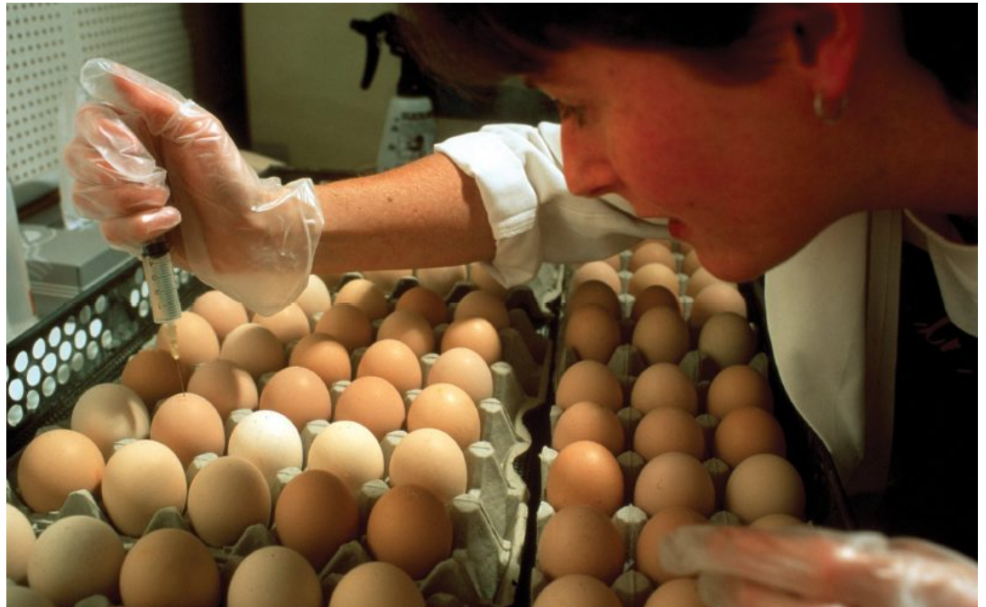
ביצים הן מהגורמים להפצת חיידק הסלמונלה

פרץ ח. 2019. תחלואה בקמפילובקטר ובסלמונלה בישראל, והקשר החיובי בינה לבין טמפרטורת הסביבה. אקולוגיה וסביבה 10(4): 79–80.