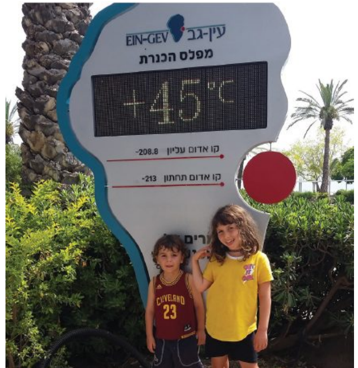
גל חום בכינרת. גלי החום צפויים להיות תכופים, חזקים וארוכים יותר