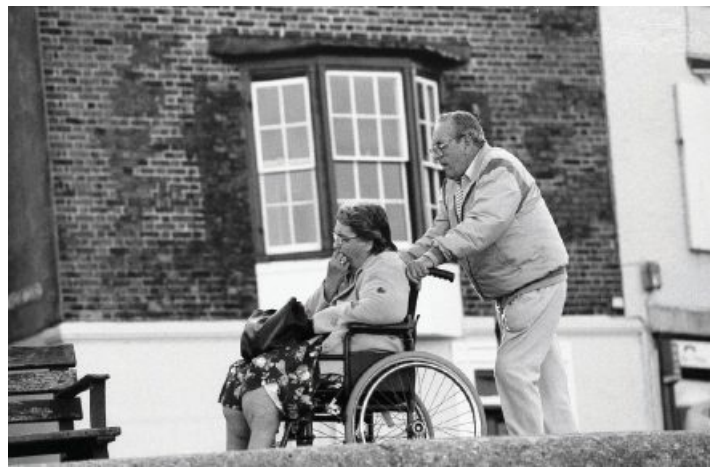
קשישים נמצאים בסיכון גבוה לתחלואה ולתמותה עקב גלי חום כבדים

במדעי החברה קיימים פערי ידע באשר לקשר בין שינוי האקלים לבין התנהגות מקדמת בריאות, כגון פעילות גופנית, דפוסי שימוש בתחבורה (רכב פרטי לעומת תחבורה פעילה כגון הליכה, אופניים ותחבורה ציבורית) ושהות בחוץ (למשל שהות פעילה בחוץ של ילדים). מרכיב חשוב נוסף בהיערכות לשינוי האקלים הוא חוסן ברמה העירונית והקהילתית (ראו עוד בגיליון זה). חוסן נחקר בישראל רבות בהקשר המלחמתי, ומעט בהקשר של שינוי האקלים, וקיימים פערי ידע לגבי החוסן של אוכלוסיות שונות לאירועי קיצון ולשינוי האקלים בטווח הארוך. כמו כן, חסרים בישראל מחקרים על השפעת שינוי האקלים על הנושאים הבאים: פערים בבריאות ונגישות לשירותי בריאות (בחתכים כגון אזור מגורים, הכנסה, תעסוקה ודת); מידת ההיערכות של מערכת הבריאות לשינוי האקלים ודרכים לשיפורה (תוך התייחסות להזדקנות האוכלוסייה ולתרחישים כגון קריסת מערכת החשמל); היבטים כלכליים של השפעות שינוי האקלים על הבריאות (כגון שינויים בהוצאות על בריאות ובתפוקת עבודה). תחום חדש ומתפתח במחקר העולמי על אודות הקשר בין שינוי האקלים ובריאות, שטרם פותח בישראל, הוא מחקר שיעסוק בדרכים לשיפור החיים, העבודה ובילוי שעות הפנאי בטמפרטורות גבוהות יותר ובאקלים קיצוני יותר. על תחום זה לשלב ידע בין-תחומי מתחומים כגון רפואה, אפידמיולוגיה, פיזיולוגיה, תכנון ערים ולימודי תרבות, והוא חיוני להיערכות מיטבית ומקיימת לשינוי האקלים בתחום הבריאות [8].