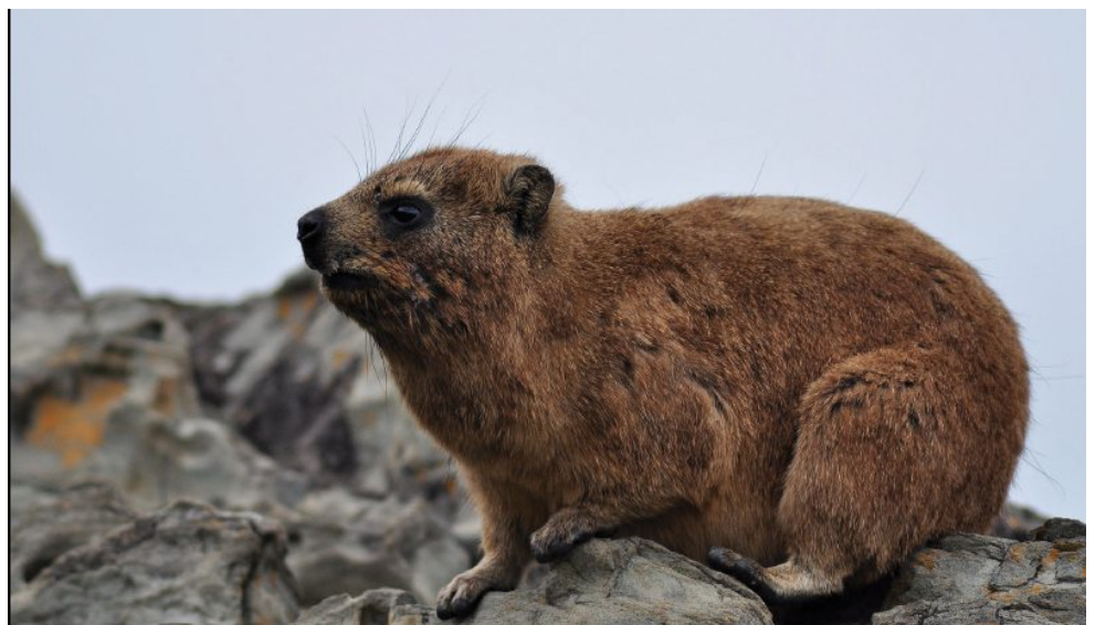
שפן סלע ( Procapra capensis ). שכיחותה של מחלת שושנת יריחו, הנגרמת מטפיל מסוג לישמניה, נמצאת במגמת עלייה בישראל ובמדינות שכנות. הטפיל מועבר לאדם על-ידי נקבת זבוב החול, שנדבקת בו לאחר שעקצה בעל חיים נגוע. החיה העיקרית המעבירה אותו באזרחי היא שפן הסלע

בטווח הארוך ישפיע שינוי האקלים הצפוי בישראל על בריאות האדם בתחומי חיים רבים. למשל, צמצום השעות הנוחות להליכה, לטיול, למשחק ולפעילות גופנית בחוץ עשוי להשפיע על רמות הפעילות הגופנית של ילדים ושל מבוגרים. נוסף על כך, צמצום השעות הנוחות לשהייה במרחב הציבורי בחוץ עשוי להפחית מפגשים חברתיים ולפגוע בלכידות חברתית, וכך לפגוע בבריאות הנפשית והחברתית. ההשפעה של שינוי האקלים בתחומים נוספים, כגון חקלאות ומשאבי טבע, עשויה אף היא לפגוע בבריאות האדם וברווחתו. ברמה הבין-לאומית מתרחבת התופעה של "מהגרי אקלים", שעוזבים את מדינתם בשל השפעת שינוי האקלים על הסביבה, כגון ירידה בכמות ובאיכות של המזון והמים. להגירת האקלים השלכות על הבריאות הפיזית והנפשית של המהגרים, והיא מצריכה טיפול במסגרת מערכת הבריאות במדינות הקולטות מהגרים, ובהן ישראל [16]. תופעות אלה השפיעו וימשיכו להשפיע אף ביתר שאת גם על אזרחי ועל מדינת ישראל בפרט.