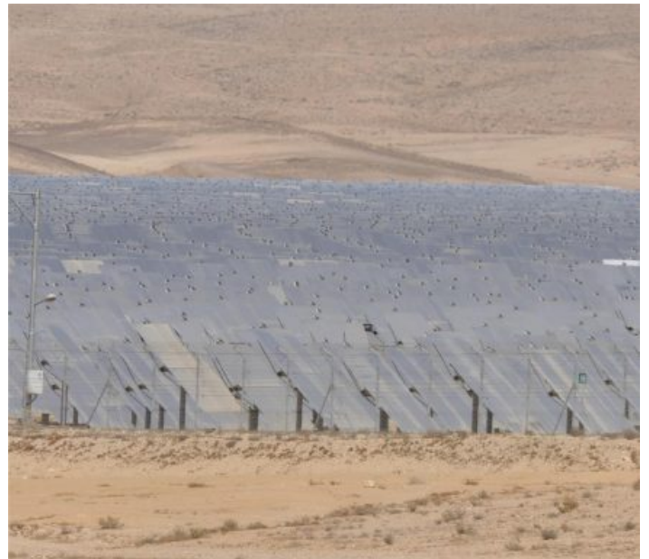
מיזמים פוטו-וולטאיים ותרמו-סולריים באשלים. המיזמים מבוססים על מכרזים שערכה מדינת ישראל והובילו ליצירת מודל שותפות של "החכרת קרקע", בין המגזר הפרטי לקהילה המקומית. במסגרת זו, יזמים פרטיים מממנים את המתקנים הסולריים – מקימים ומתפעלים אותם, ותרומתה העיקרית של קהילה המקומית היא בהחכרת הקרקע שבבעלותה

לסיכום, שותפויות בין קהילות מקומיות למגזר הפרטי מסייעות לקדם אנרגיה מתחדשת, ברחבי העולם וכן בישראל, ולפיכך הן מרכיב חשוב בהתמודדות עם שינוי האקלים. התרומה המשמעותית בזיהוי מודלים שונים של שותפויות נוגעת לאפיון ההטרוגניות שלהן, גם בהיבט המשאבים השונים הנדרשים משני הגורמים המשתתפים בהן, וגם בהיבט השפעתן המגוונת על קידום אנרגיה מתחדשת. בהתאם לכך, זיהוי המודלים ואפיונם צפויים לאפשר ליזמים פרטיים ולקהילות מקומיות לבחור במודל השותפות המתאים ביותר בעבור כל אחד מהם. בד בבד, הדבר צפוי לסייע לקובעי מדיניות לעצב אסדרה שתעודד את מודל השותפות המועדף עליהם לצורך קידום אנרגיה מתחדשת.