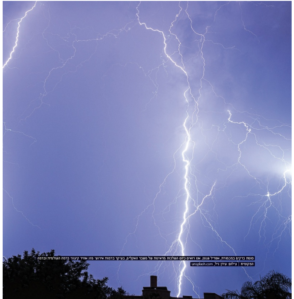
סופת ברקים במכמורת, אפריל 2018. אנו רואים כיום השלכות מדאיונות של משבר האקלים, בעיקר בדמות אירועי מזג אוויר קיצוני ברמה העולמית וברמה המקומית

במדינת טקסס לבדה, נאמדו ב-1.1 מיליארד דולר בהוצאות בשל תמותה ואשפוז [21] . דוגמה נוספת לפגיעה היא פריחת אצות רעילות הגורמת לירידה בתועלת שהנופשים מפיקים באגמים ובמערכות ימיות אחרות [23] (ראו הרחבה בגיליון זה) .