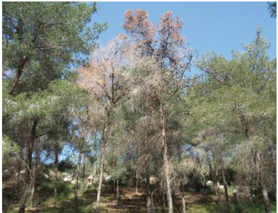
התייבשות אורנים ביער חוף הכרמל

המערכות האקולוגיות המדבריות – במערכות האקולוגיות היבשתיות של ישראל שינוי האקלים צפוי להעצים את החום והיובש, ובעיקר להשפיע במערכות המדבריות. כבר כעת ישנם ממצאים המצביעים על השפעה אפשרית של שינוי האקלים, ובהם: א. תוצאותיה של תמותת שיחים בדרום הערבה בין השנים 1997–2009. תמותה זו גררה ירידה בזמינות המזון לפרסתניים גדולים – יעלים וצבאים – וירידה כללית של אנרגיה במארג המזון [1]; ב. התייבשות ותמותה של שיחים בצפון הנגב יחד עם ירידה משמעותית בייצור הראשוני של המערכת וירידה כללית במגוון הצמחים ובעלי החיים, שנגרמו באופן ישיר מהתייבשות ובאופן משני בשל אובדן השיחים ששימשו מבלע למים עבור כלל המערכת באזור אילת [13]; ג. בצורת מתמשכת שהביאה לירידה של 50% בגודל אוכלוסיית היעלים [6]; ד. תמותה של שיטים, מין מפתח במארג המזון בערבה המקושרת לירידה בכמות המשקעים [4]. במערכות היבשתיות צפוי כי חלק מהצמחים ומבעלי החיים יוכלו להסתגל לתנאים החדשים ולהישאר באותם אזורים, ואילו מינים שלא יוכלו להסתגל, צפויים להגר צפונה, אל אזורים שיתקיימו בהם תנאים דומים לתנאים שהורגלו אליהם. כדי שהמינים האלה ישרדו ויצליחו להגר צפונה, הם צריכים רצף של שטחים טבעיים. שטחים בנויים, שטחים חקלאיים ותשתיות, הקוטעים את הרצף הטבעי, עלולים להגביל את הנדידה צפונה של מינים אלה ולהוביל להכחדה [3].