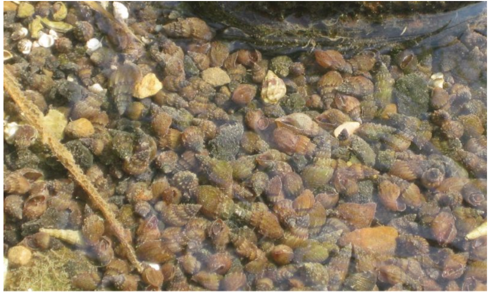
חלזונות מהמין הפולש Thiara scabra במים רדודים לחוף הכינרת, נובמבר 2018. הפלישה הנרחבת של החילזון מקושרת לשינויי המפלס