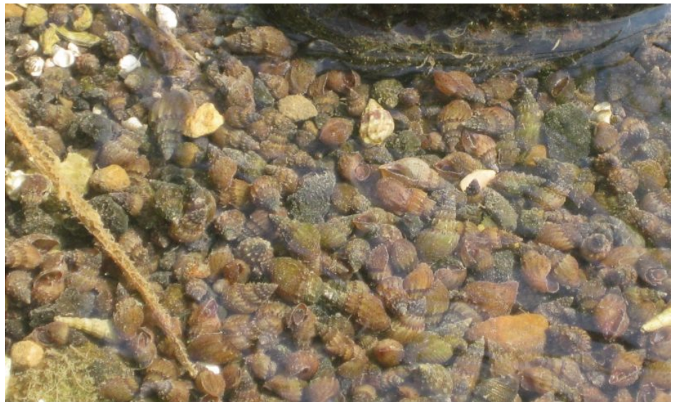
חלזונות מהמין הפולש Thiara scabra במים רדודים לחוף הכינרת, נובמבר 2018. הפלישה הנרחבת של החילזון מקושרת לשינויי המפלס

מפרץ אילת: פגיעה בשוניות האלמוגים – על פי מחקרים מהשנים האחרונות [24,21] אלמוגים בשונית במפרץ אילת מראים עמידות לטווח של עלייה ב-1-2 מעלות צלזיוס מעל הטמפרטורה המרבית שהם חשופים אליה בקיץ כעת וכן לעלייה בחומציות המים. האלמוגים במפרץ אילת הסתגלו לחום הרב של דרום ים סוף, ועל כן יהיו מסוגלים לשרוד היטב במפרץ אילת הקר יותר גם אם הטמפרטורות בו יעלו במספר מעלות, כפי שקורה וצפוי להימשך במהלך העשורים הבאים.