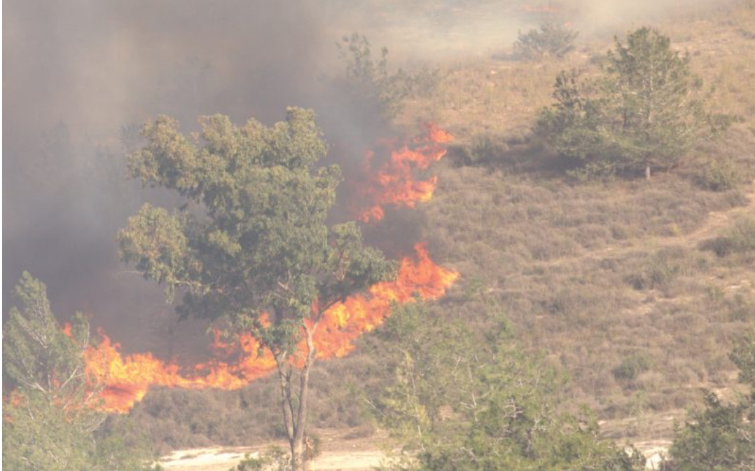
שרפה ברמות מנשה. שרפות הן אחת התופעות שמתקשרות באופן הדוק לשינוי האקלים