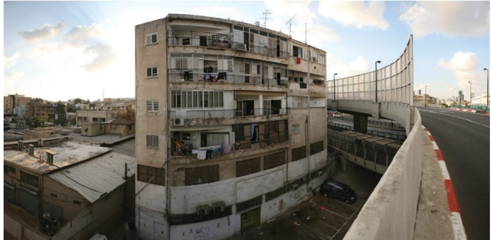
בית מגורים הצמוד לרמפת הכניסה לתחנה המרכזית בתל-אביב

של המיזם. בתחומים מסוימים קיים דגש על אוכלוסיות רגישות ועל צמצום פערים בבריאות. נוסף על כך, עלה שהתסקירים העלו את המודעות של מקבלי החלטות להשלכות של מיזמים על הבריאות באופן שעשוי להשפיע גם על החלטות עתידיות, הרחיבו את הלגיטימציה למעורבות של אנשי בריאות בקבלת החלטות בתחומים אחרים [13,14,16], ותרמו לשיתוף הציבור בהחלטות שישפיעו על בריאותו. עם זאת, הייתה שונות רבה בין התסקירים, למשל ברמת ההשפעה על החלטות או במידת השיתוף של הציבור. כמו כן, תסקירים רבים לא כללו את השלב החמישי בתסקיר – הערכה, ניטור ומעקב – עובדה שמקשה על ההערכה של השפעתם [29].