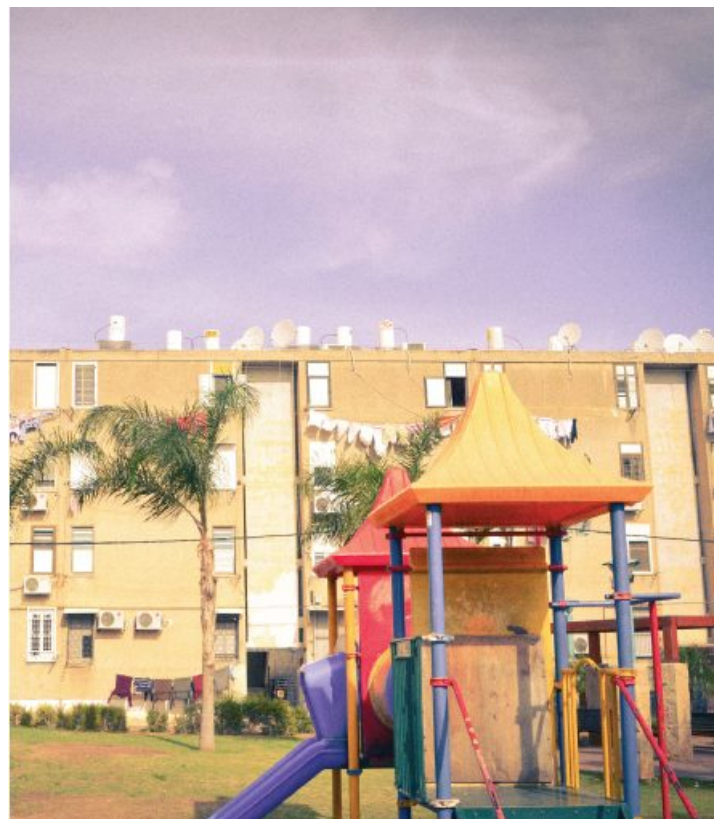
לתכנון הפיזי של שכונה יש השפעה על בריאות המתגוררים בה.