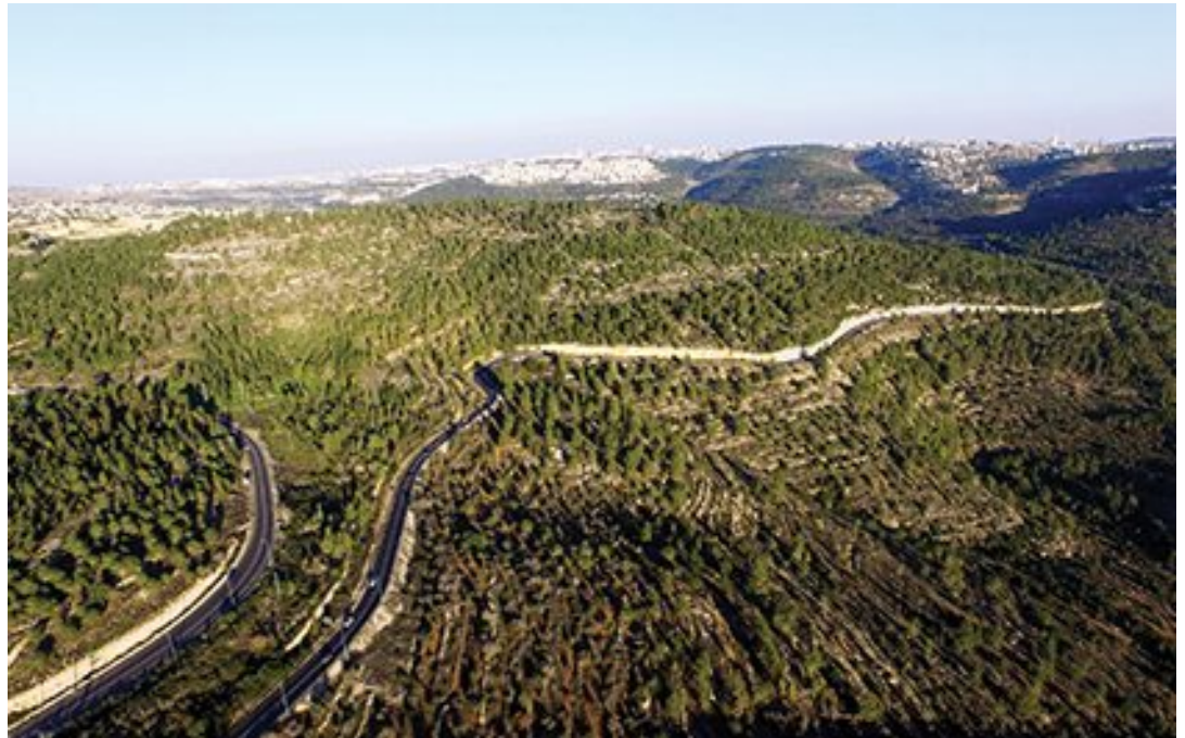
הר חרת והכביש המוביל לכיכר הסטף. אזור זה הוא חלק מהחיץ האקולוגי על פי תוכנית המתאר המחוזית (תמ"מ 30/1). באופק: משמאל מבשרת ציון, מימין בית החולים הדסה עין כרם. על פי התוכניות כאן יעבור כביש הטבעת המערבי בתוואי החדש

דין ל ואלישר י. 2019. המאבק על רכס לבן – תמרור אזהרה לעתיד הרי ירושלים ולשטחים הפתוחים בכלל. אקולוגיה וסביבה 10(2): 47-49.