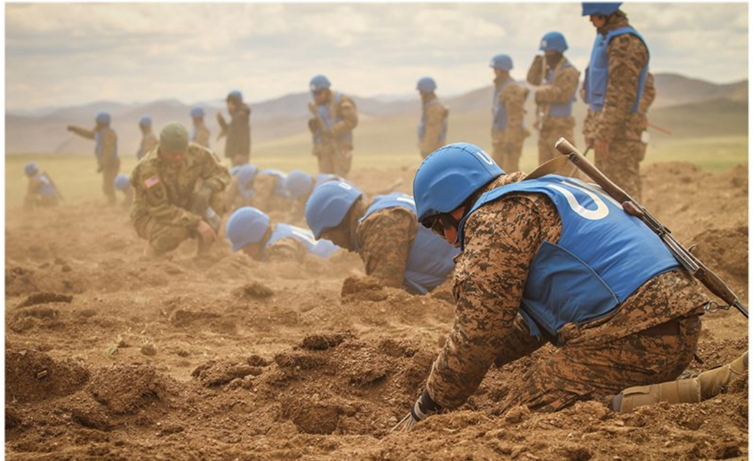
חיילים אמריקאים מאמנים חיילים מונגולים בפינוי מוקשים. מונגוליה, 2016

המחלקה לפיסיקה יישומית, ביה"ס להנדסה ולמדעי המחשב,