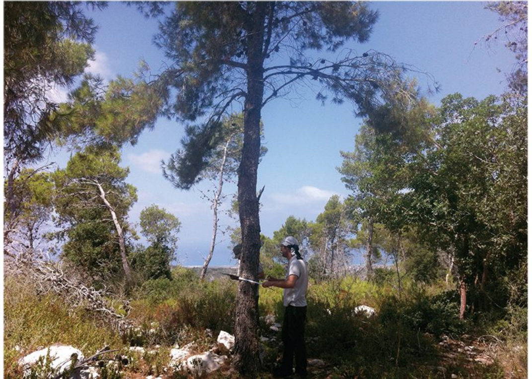
דגימת עצי אורן ירושלים. הערכת גיל העץ נעשית על פי היקף הגזע בגובה החזה

החוג לביולוגיה וסביבה, הפקולטה למדעי הטבע, אוניברסיטת חיפה - אורנים