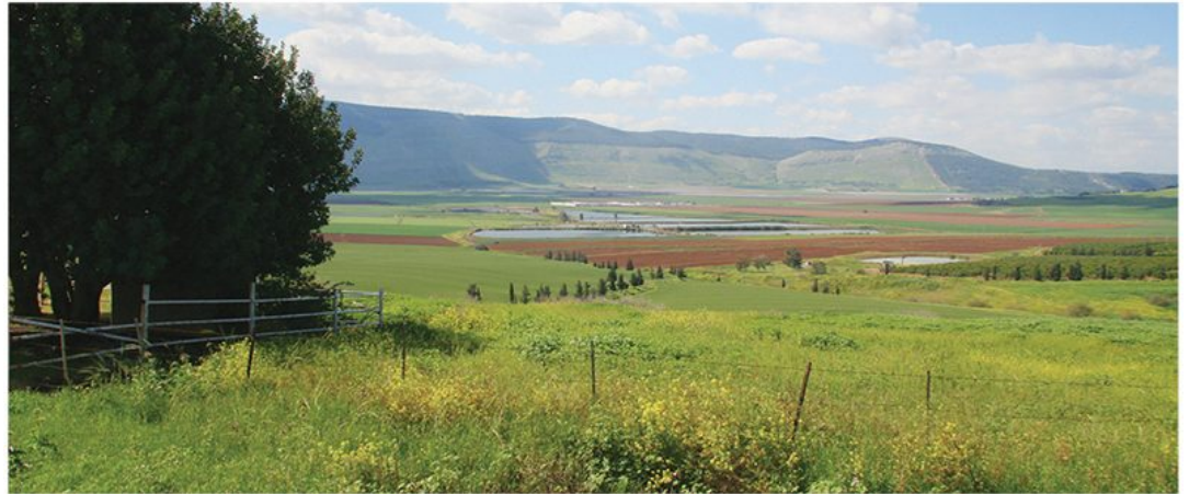
המסדרון האקולוגי בין רמת צבאים גלובע עובר דרך עמק חרוד. מגוון שטחי החקלאות, המאגרים ותעלות המים מגדיל את המורכבות המבנית של הנוף ומאפשר מעבר של מינים רבים

רוזנפלד א. ורותם ד. 2019. השפעת גידור, תשתיות ובינוי על נוכחות יונקים גדולים ובינוניים במרחב, כבסיס לבחינת תפקודם של מסדרונות אקולוגיים קיימים ולתכנון מסדרונות חדשים. אקולוגיה וסביבה 10(1).