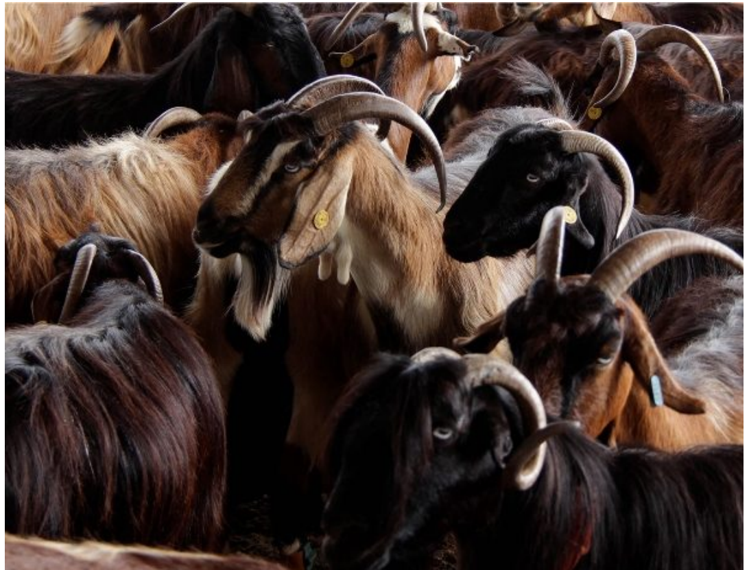
המחקר נערך בפארק הטבע רמת הנדיב. ברמת הנדיב עדר של 180 עיזים המשמש כלי ממשק לטיפול בחורש לצורך הגדלת מגוון בתי הגידול, הקטנת כיסוי הצומח המעוצה ומניעת שרפות. העדר רועה בפארק הטבע על פי תוכנית רעייה המותאמת לפארק. הרעייה בפארק מלווה בניטור השינויים בכיסוי הצמחי באזורי הרעייה השונים וגם במעקב אחר ביצועי העדר ואיכות החלב המופק לאחר ההזנה במרעה