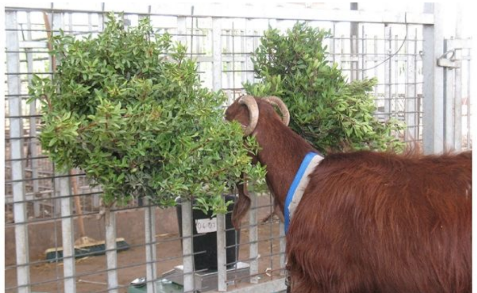
ניזונה מאלת מסטיק במהלך ניסוי העדפה

הממצאים מלמדים כי עיזים במרעה חורש ים תיכוני ערות להבדלים בין פרטים שכנים של אלת המסטיק, והדבר מתבטא בהתנהגות הרעייה שלהן. ניתן להעריך כי העדפות בין צמחים שכנים מאותו המין קיימות גם אצל אוכלי צמחים נוספים הניזונים מאוכלוסיות מקומיות של מינים מעוצים אחרים בחורש. לכן, בביצוע תצפיות על הנעשה בחורש מומלצת ערנות גם למתרחש בתוך רמת המין.