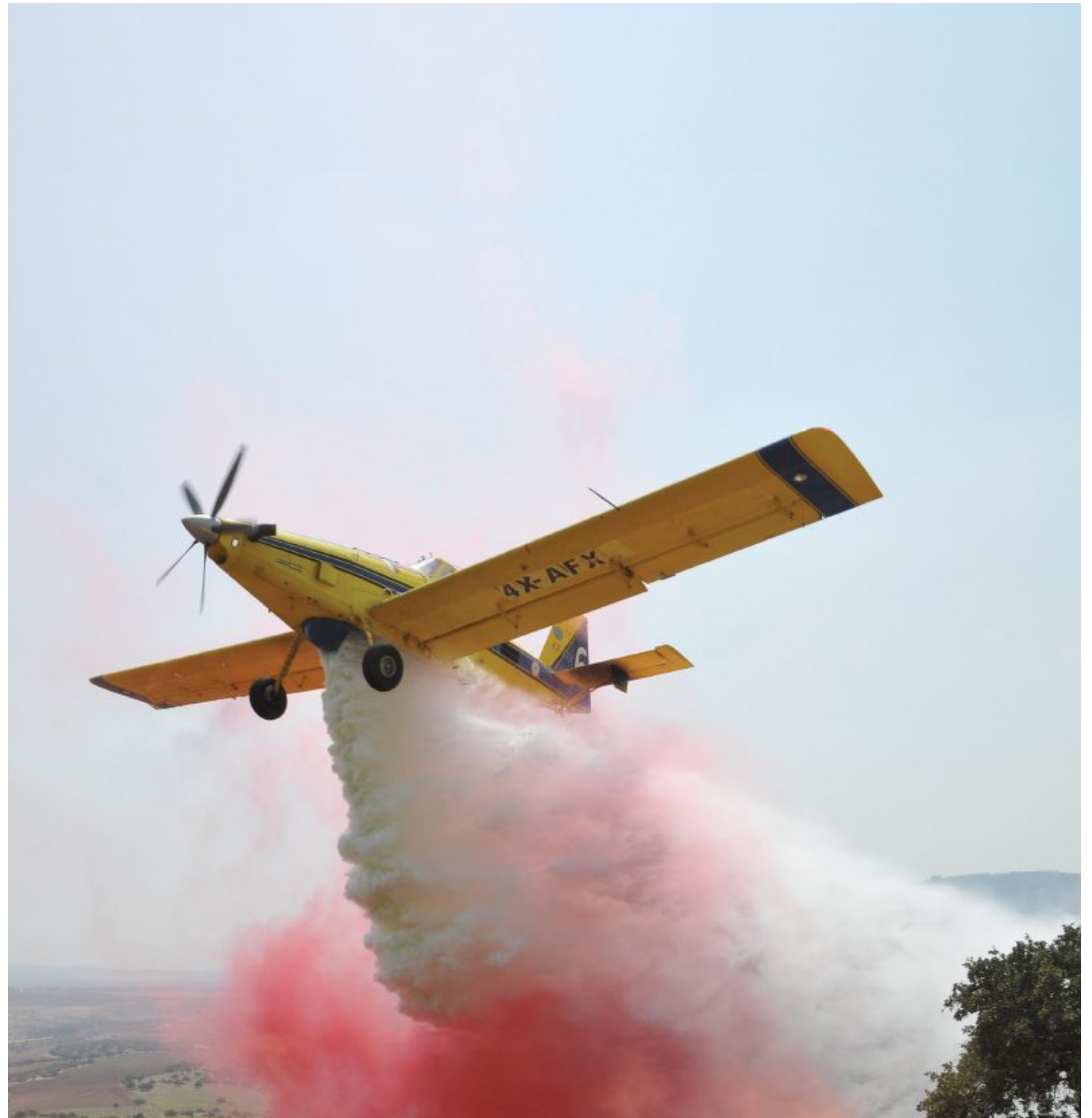
מטוס כיבוי מטייסת הכיבוי 'אלעד', בתרגיל ביער בית קשת. "שריפות בשטחים פתוחים צפויים לפרוץ בתדירות ובעוצמות גדולות יותר. היות שהגורם האנושי הוא המשמעותי ביותר, ניתן לפעול לצמצום מספר השריפות, תוך בחינה של הגורמים להן ושל עלות כיבוי"

לוי ש, דיסני ד, שכטר מ ונאמן ג. 2018. הגורמים לשריפות ביערות ובחורשים בישראל ועלות כיבוי. אקולוגיה וסביבה 9(2): 42-48.