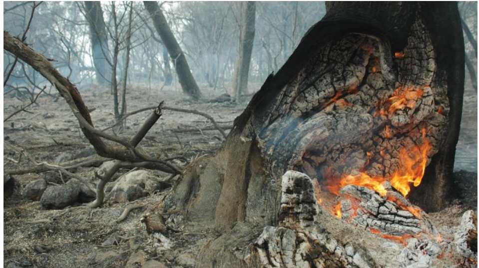
שריפה באזור אוניברסיטת חיפה, 8.4.2005. "הבנת הגורמים לשריפה והשפעתו של כל אחד מהם על עלויות הכיבוי תאפשר למקבלי ההחלטות כלים טובים יותר ליצירת תוכניות מניעה"