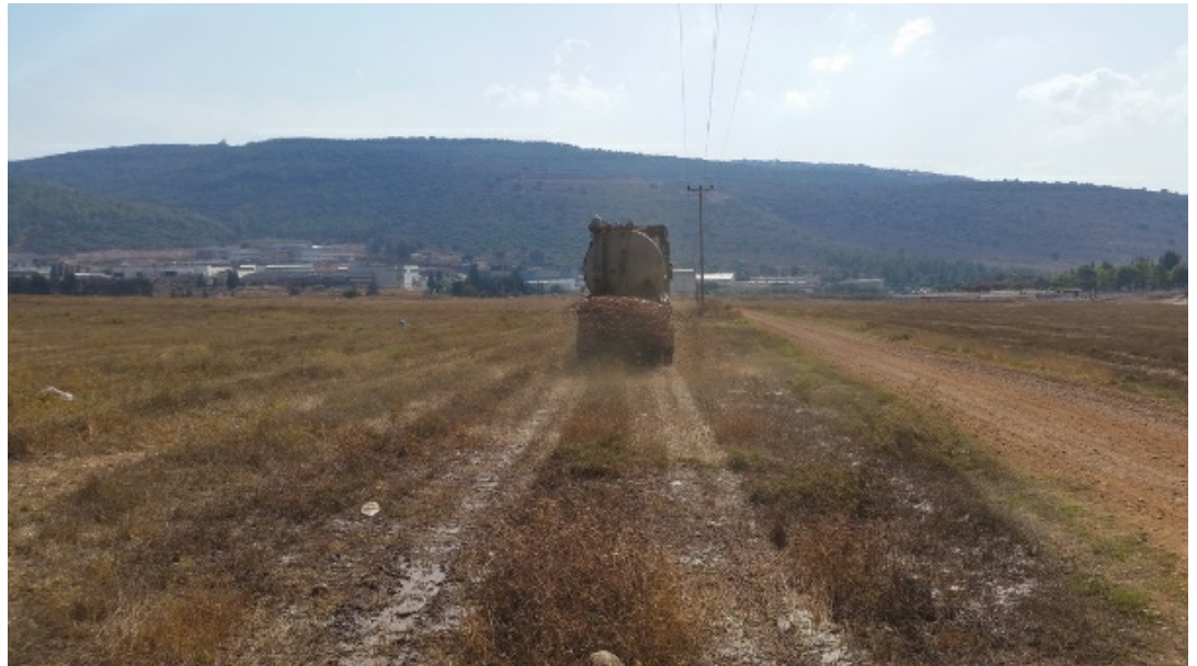
פיזור עקר בשטחים לא מעובדים. את הפיזור ביצעו קבלנים ששכרו איגודי המים והביוב

רדאעי א. 2018. ייצור שמן זית לא מחייב פגיעה בסביבה – הצלחה בפיזור העקר מבתי בד בעונת המסיק 2017. אקולוגיה וסביבה 9(1): 5-6.