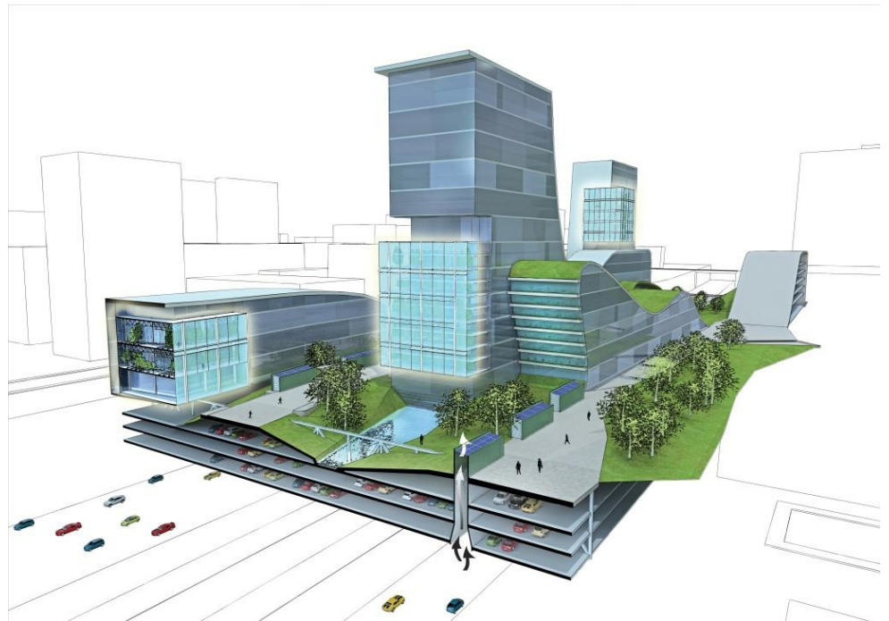
Highway Habitat – פרויקט גישור מעל איילון המציע חיבור בין שני חלקי המטרופולין, שנחצים על-ידי רצועת התשתיות: ניצול מיטבי של הקרקע, פארק עירוני לינארי, פרוגרמת עירוב שימושים ומערכות לטיהור אוויר באמצעות צמחייה | תכנון: קנפו כלימור אדריכלים

כלימור ת. 2016. פוטנציאל השכבות העירוניות הנסתרות. אקולוגיה וסביבה 7(3).