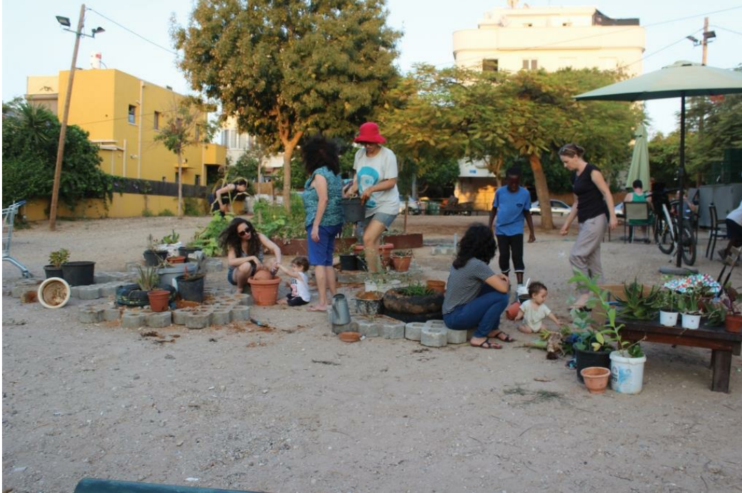
גינת תבלינים שהוקמה ביוזמת 'קפה שפירא' בשטח הסמוך לבית הקפה, משמשת נקודת מפגש קהילתית. לידה קמה גינת סוקולנטים ביוזמת פורום החקלאות השכונתית, הפועל לטיפוח חקלאות וגינון בשכונה. שכונת שפירא, תל-אביב

ליבוביץ ל, אטינגר ל ורונן א. 2016. משכונה קיימת לשכונה מקיימת – תפקידם של סוכני שינוי מקומיים בקידום אורח חיים מקיים בשכונה. אקולוגיה וסביבה 7(3): 215-213.