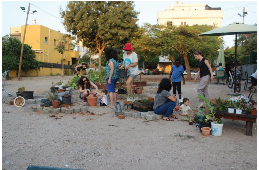
גינת תבלינים שהוקמה ביוזמת 'קפה שפירא' בשטח הסמוך לבית הקפה, משמשת נקודת מפגש קהילתית. לידה קמה גינת סוקולנטים ביוזמת פורום החקלאות השכונתית, הפועל לטיפוח חקלאות וגינון בשכונה. שכונת שפירא, תל-אביב

ליבוביץ ל, אטינגר ל ורון א. 2016. משכונה קיימת לשכונה מקיימת – תפקידם של סוכני שינוי מקומיים בקידום אורח חיים מקיים בשכונה. אקולוגיה וסביבה 7(3): 213–215.