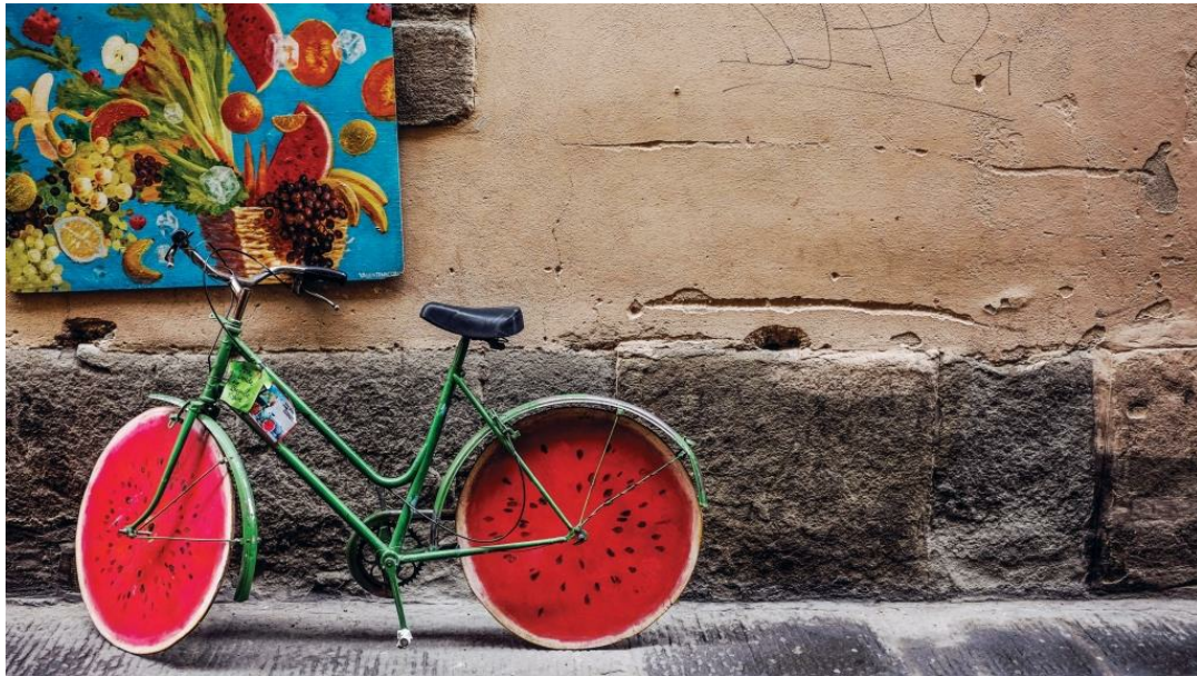
שימוש באמצעי תחבורה מקיימים, מזון מקומי ובריא, צריכה מושכלת ומקיימת של מוצרים – כולם מרכיבים של אורח חיים עירוני מקיים