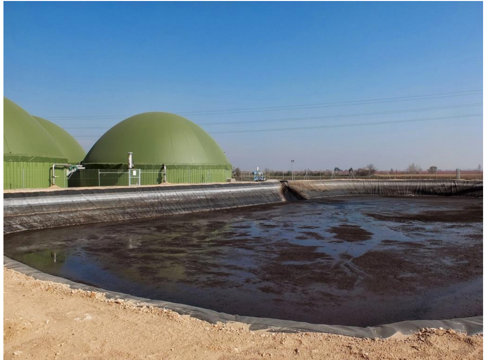
מתקן להפקת ביוגז מזבל בעלי חיים