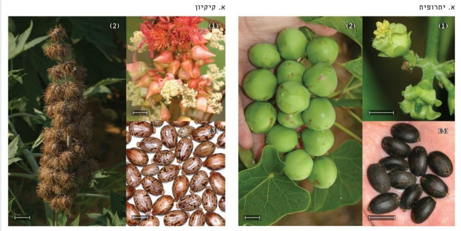
איור 1 צמחי ביודיזל, יתרופית (א) וקיקיון (ב), המפותחים במרכז וולקני: פרחים (1), פרות (2) וזרעים (3). כל קו מתחת לאיור מייצג 1 ס"מ.

איור 1. צמחי ביודיזל, יתרופית (א) וקיקיון (ב), המפותחים במרכז וולקני: פרחים (1), פרות (2) וזרעים (3). כל קו מתחת לאיור מייצג 1 ס"מ.