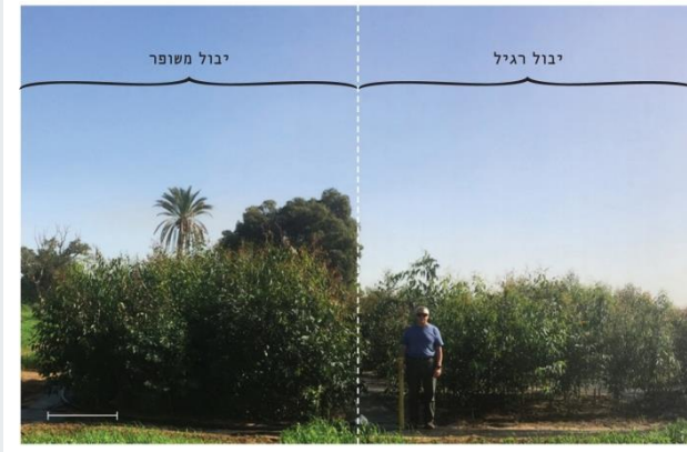
איור 2. חלקת השבחה של איקליפטוס המקור לבימוסה, בגיל 4 חודשים משתילה; השוואה בין יבול רגיל (ביקורת) ליבול משופר בצמחים מושבחים. הקו בצד שמאל למטה מייצג 1 מטר.