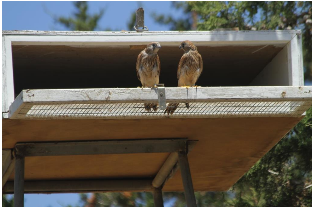
שני פרחונים של בז אדום על דלת תיבת השחרור לפני עזיבה

ארנון א, שמון ה והצופה א. 2015. אדום עולה (לטורקיה) – סיפורה של בזה אדומה. אקולוגיה וסביבה 6(2): 77–79.