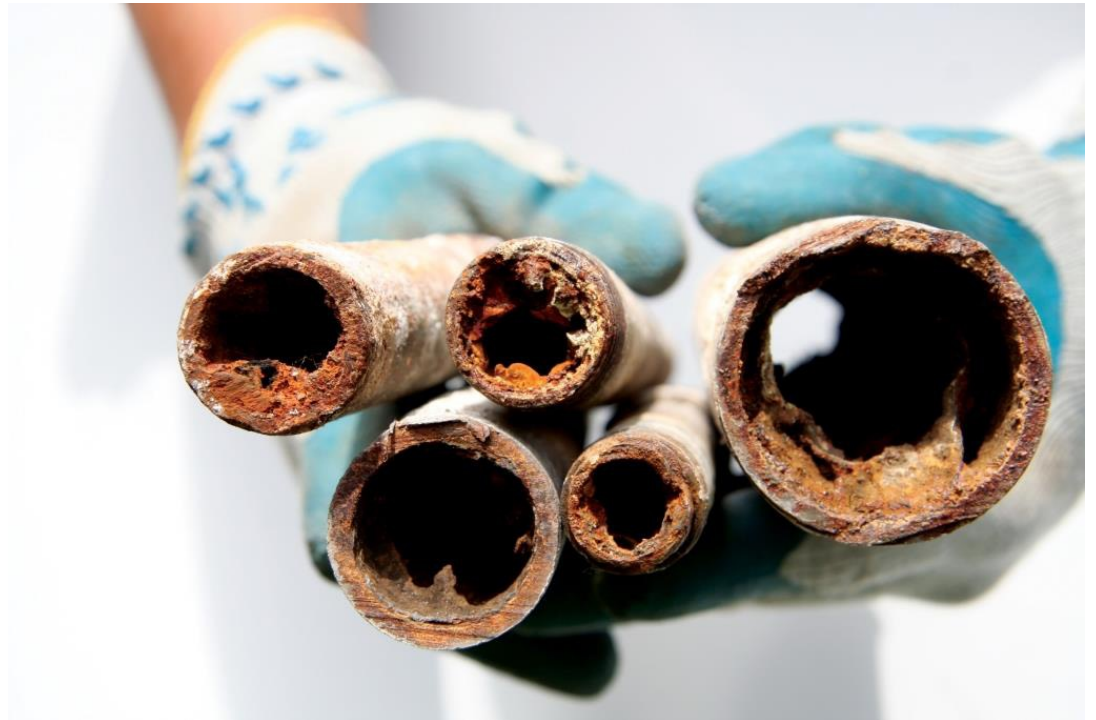
שכבות הגנה שיורכבו מחיידקים עשויות להפחית באופן משמעותי את היווצרות החורים בצנרת ולהקטין את נזקי הדליפות של מי שתייה, נפט וגז

שוטלנד י, ברעם י, לבאק א ואחרים. 2015. הגנה על צנרת מנזקי קורוזיה באמצעות ציפוי ביולוגי. אקולוגיה וסביבה 6(1): 10-12.