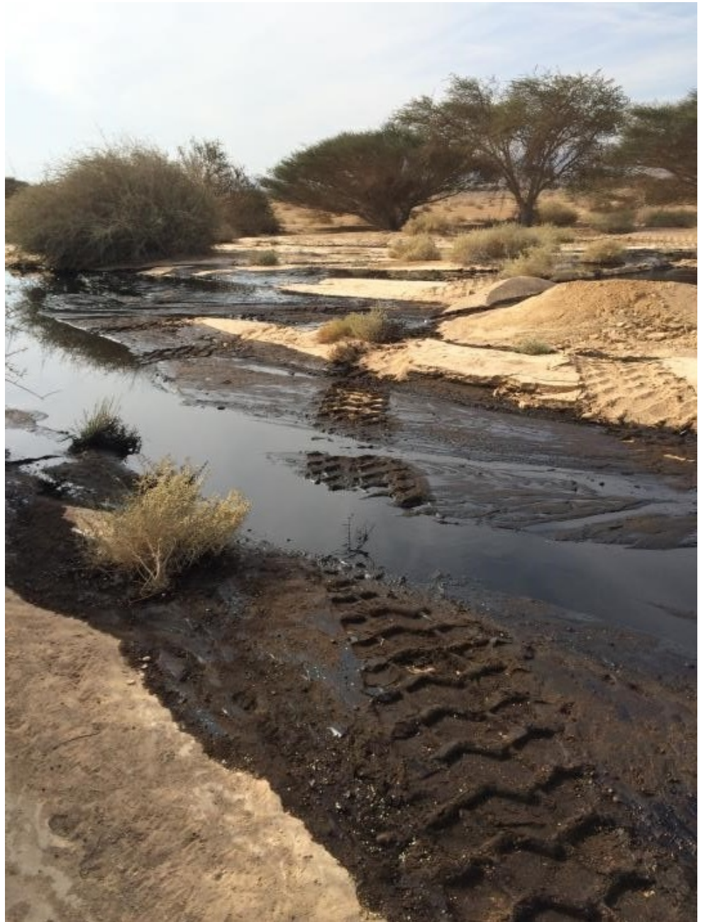
שלוליות נפט ועקבות כלים הנדסיים בלב שמורת טבע רגישה

שקדי י. 2014. דליפת הנפט במלחת עברונה – תשתית מזהמת בלב אזור רגיש. אקולוגיה וסביבה 5(3).