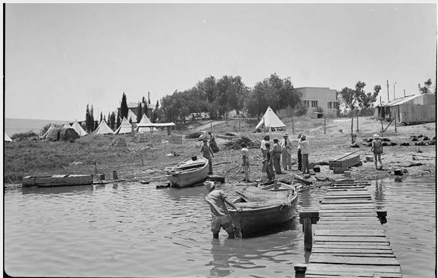
איור 2 מבט מאגם החולה לסירות הדייגים ולקיבוץ חולתה בראשיתו

המייסדים של קיבוץ חולתה הגיעו ממקומות שונים בישראל ובעולם. התקשרותם לאגם החולה אינה קשורה לחוויית ילדותם, אלא מתאימה לתחושת קשר על בסיס הזדהות עם הקבוצה והנוף הסובב אותה. ההווי החברתי והתרבותי שנוצר סביב עבודת הדיג, צורת החיים הקיבוצית ותנאי המחיה חיזקו סוג התקשרות מקומי זה (איור 2).