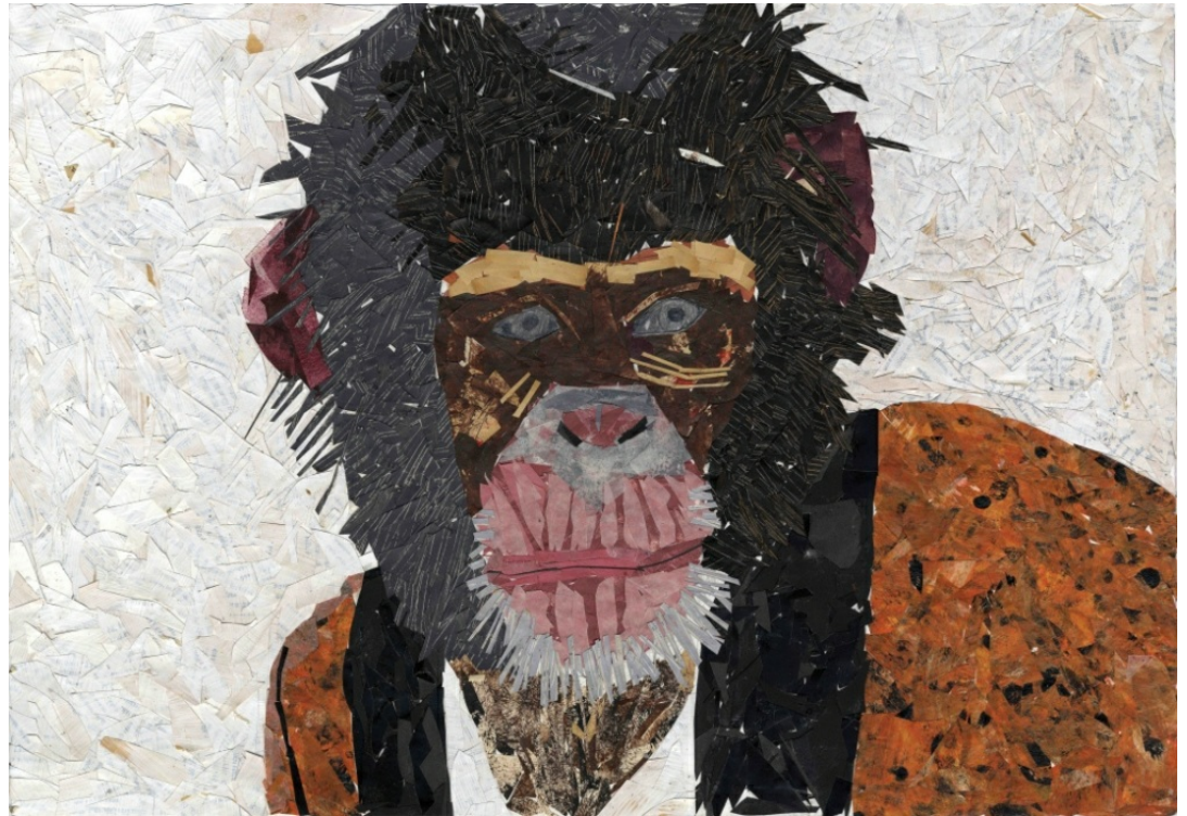
המצב התודעתי האנושי הראשוני היה של אחריות על הטבע, אך תודעה זו פחתה ככל שההיסטוריה התקדמה | ידידיה קוסמן, הקופים, קולאז' ורישום

בוקמן ש ופינק ע. 2014. עד ליום שגורילות יסחרו בבורסה – ריאיון עם ד"ר יובל נח הררי. אקולוגיה וסביבה 5(2): 202–205.