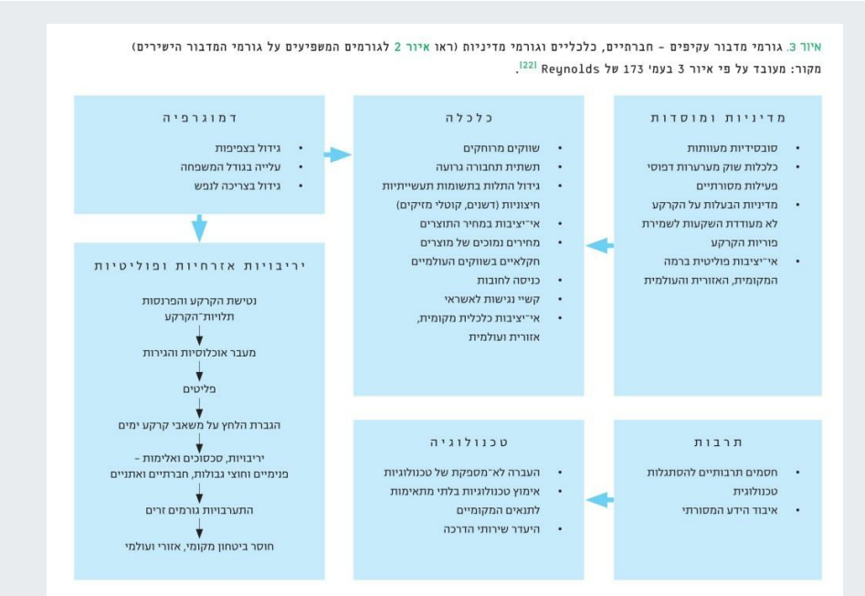
איור 3 גורמי מדבור עקיפים – חברתיים, כלכליים וגורמי מדיניות (ראו איור 2 לגורמים המשפיעים על גורמי המדבור הישירים)

הסיכונים למדבור באזורים היובשניים, שמקורם בתהליכים הביופיזיים המתרחשים בהם (איור 1), מתממשים כשאותם תהליכים מועצמים כתוצאה מפעולותיהם של המשתמשים בקרקע, ונעשים גורמי המדבור הישירים (איור 2). תורמים לכך גורמי המדבור הבלתי ישירים – הגורמים הדמוגרפיים, הכלכליים, הטכנולוגיים, המוסדיים והתרבותיים, וגורמי מדיניות וממשל (איור 3). כל אחד מאלה עשוי לדחוק את המשתמשים בקרקע לניצול יתר, המעצים את הגורמים הישירים למדבור, וזאת בגין נסיבות מקומיות (עוני, סכסוכים) או אף בגין תהליכים ומדיניות ברמה האזורית והעולמית [27].