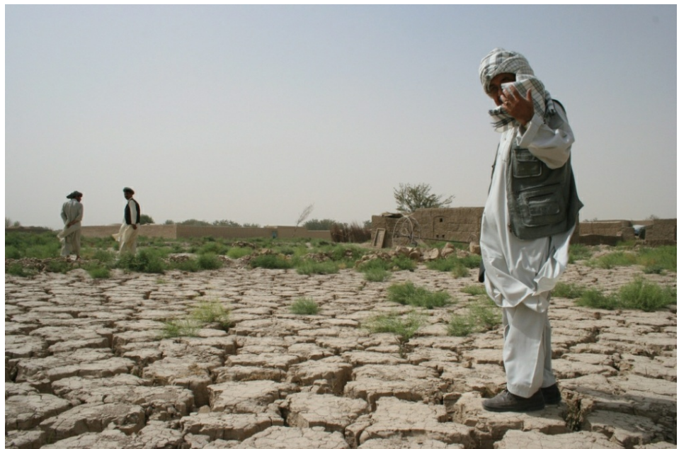
אדמה שעברה מדבור. צפון אפגניסטן, © 2006 ACNUR/V.Tan

צעד ראשון במניעת מדבור נוסף ובשיקום שטח שעבר מדבור, הוא זיהוי גורמי המדבור וטיפול משולב בהם [31] באמצעות "ניהול קרקע מקיים" (Sustainable Land Management). ניהול זה אמור להביא לאספקה מרבית של תוצרים ביולוגיים מבלי לחצות את סף הניצול המקיים. התנהלות זו משמרת את אספקת שאר שירותיה האקולוגיים של הקרקע, שרובם מעניקים את התמיכה הדרושה לאספקת התוצרים, ומקנים למערכת הקרקע עמידות ללחצים סביבתיים [11].