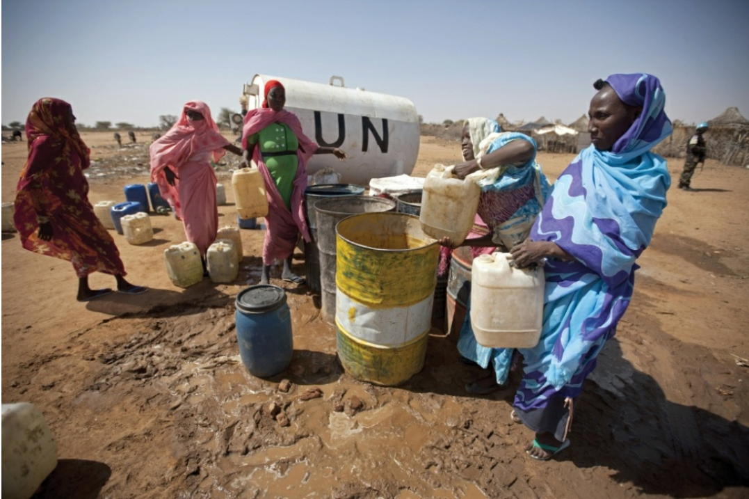
פליטות מחבל דארפור ממלאות כלי מים עבור משפחותיהן ממכל שסיפקה סוכנות הסיוע של האו"ם. סודאן, 2011

ספריאל א. 2014. המדבור – בעיה מקומית וסיכונים עולמיים. אקולוגיה וסביבה 5(2): 152–160.