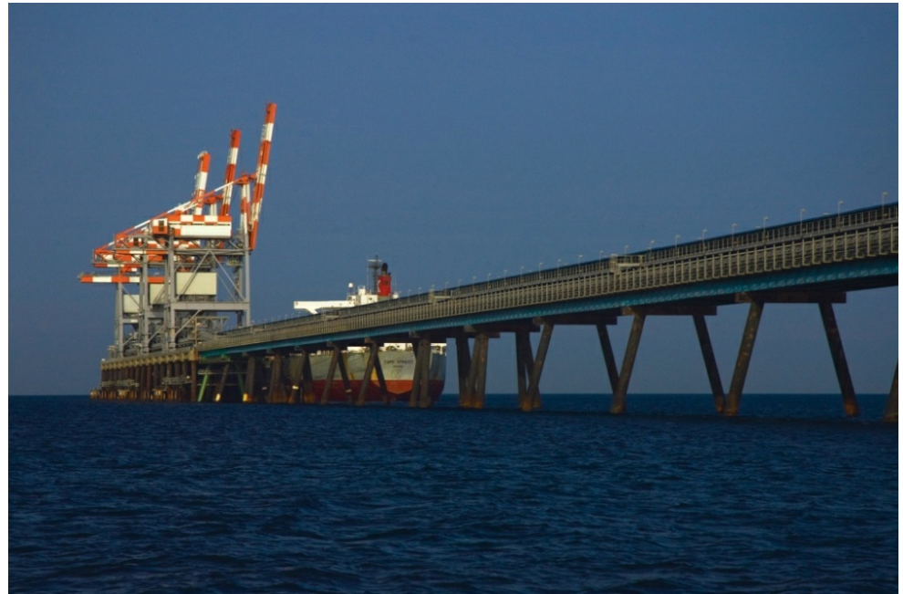
מסוף הפחם בתחנת הכוח בחדרה. בצמידות אליו הוקם מתקן התפלה

מזר, שפירא, גליק וניר. 2014. מיזם "מדיניות מרחב ימי ישראל" – התאמת המדיניות לאתגרים החדשים במימי ישראל. אקולוגיה וסביבה 5(1).