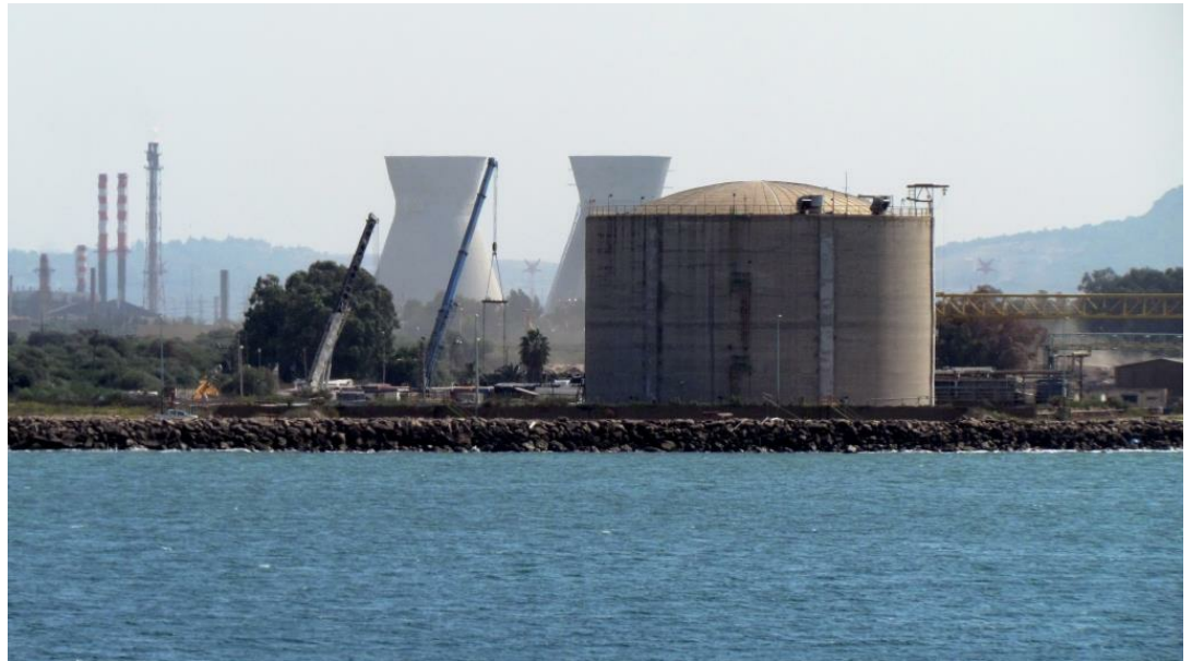
על אף פעילות ממשלתית לסגירת מכל האמוניה, הסכנה הפוטנציאלית הגלומה בו לתושבי האזור תיוותר על כנה עד לפינויו

המחלקה לזרימה ומעבר חום, הפקולטה להנדסה, אוניברסיטת תל- אביב