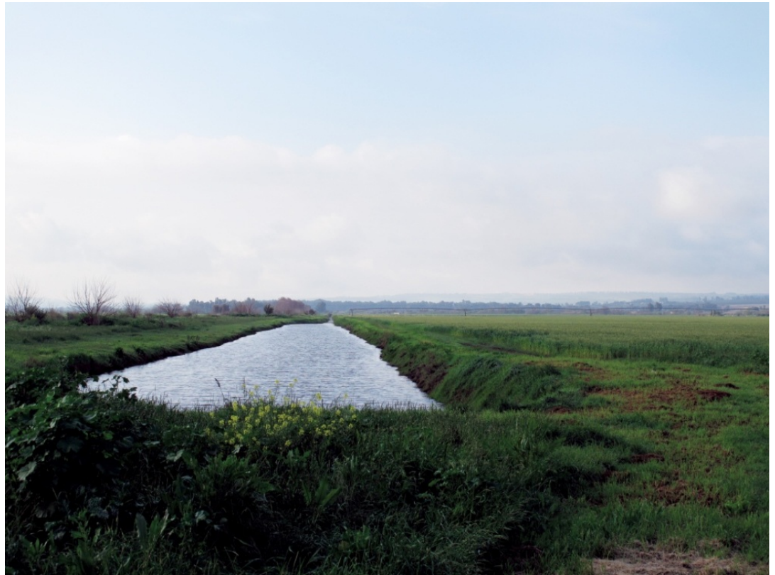
רוב הריסוס נעשה באביב ובקיץ, ובבוא גשמי הסתיו נשטפים חומרי ההדברה לנחלים

היחידה להנדסת סביבה, מים וחקלאות, הפקולטה להנדסה אזרחית וסביבתית, טכניון – מכון טכנולוגי לישראל