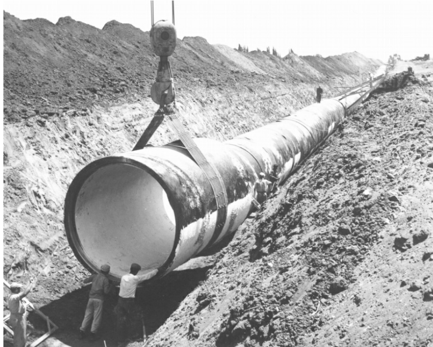
הנחת קטע מצינור המוביל הארצי סמוך לעילבון בשנת 1959