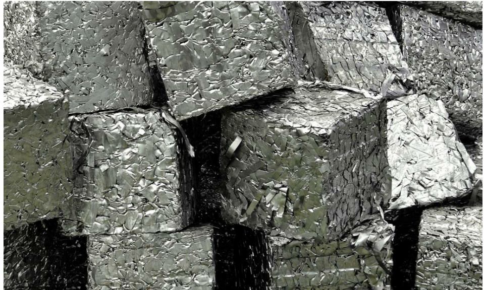
מחזור פלדה מבוצע ללא פגיעה באיכותה, וכך נחסכים חומרי גלם אחרים, כמו עפרות ברזל, פחם וסיד | © ThyssenKrupp AG חברת

ניתוח השפעות סביבתיות על בסיס גישת מחזור החיים התבסס בשנים האחרונות כמודל מוביל לכימות השפעות סביבתיות במגוון קטגוריות השפעה ולאורך מחזור החיים של מוצרים, שירותים ותהליכים. חברות, ארגונים סביבתיים ומשרדי ממשלה ברחבי העולם החלו משתמשים בגישה כדי להעריך את ההשפעות הסביבתיות של חלופות שונות ולהשוות ביניהן. חברות כמו דופונט, Levi Strauss & Co, G&P ונסטלה משתמשות בגישה לבחינת פעילויותיהן ולגיבוש אסטרטגיות סביבתיות. נוסף על כך, החלה מגמה לעידוד צריכה בת-קיימא המבוססת על הנגשת תוצאות ניתוח מחזור החיים לצרכנים באמצעות מנגנונים שונים, כדוגמת תו ירוק. צרפת מובילה כיום בתחום.