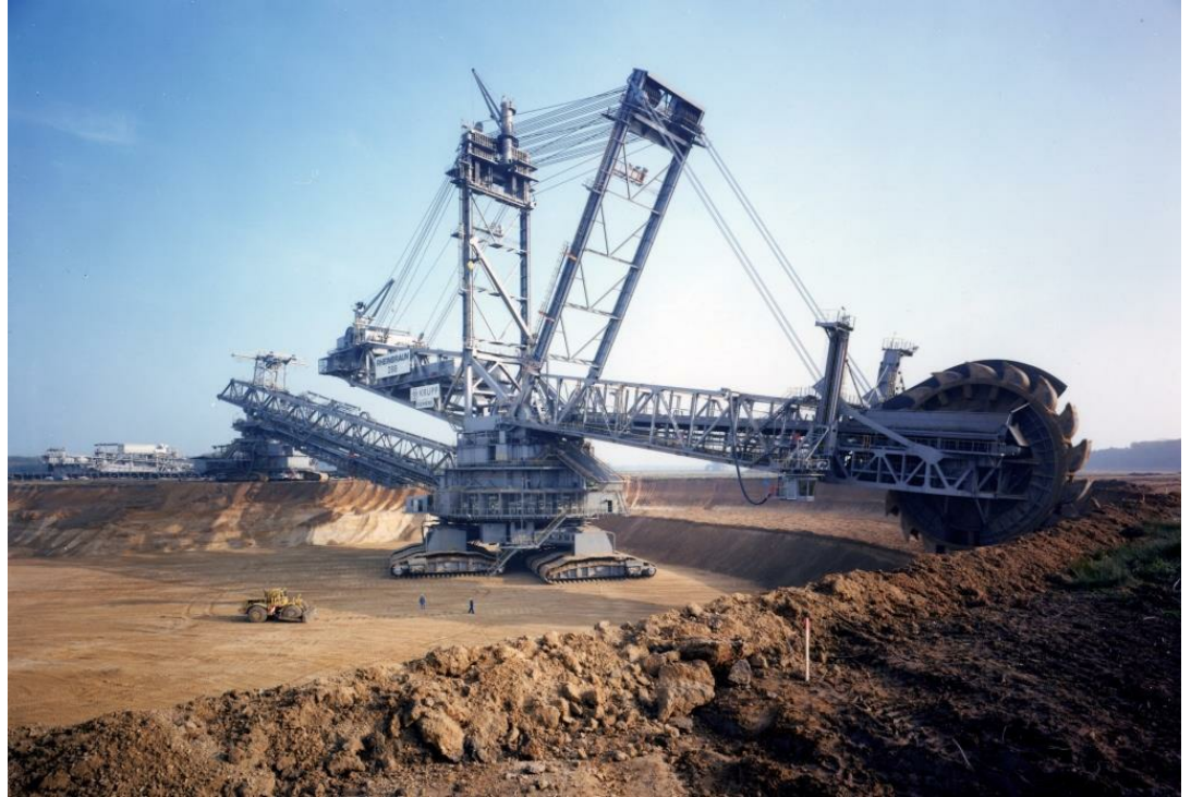
כריית פחם חום (lignite) באמצעות מחפר ענק המופעל במכרות פתוחים, ב-Hambach (גרמניה)

בלאס ו. 2012. אקולוגיה תעשייתית – התפתחות התחום ויישומים רלוונטיים. אקולוגיה וסביבה 3(4): 298–300.