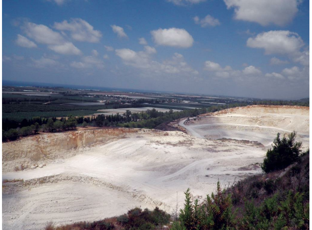
חלופה מחצבת עין איילה (מבט מערבה)

שורץ ופפאי נ. 2012. חשיבותו הסביבתית של מעבר משק החשמל לגז טבעי. אקולוגיה וסביבה 3(3): 274-275.