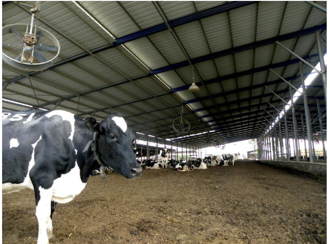
סכנה מרווחת לפרות חולבות. רפת בקיבוץ יזרעאל

צדיקוב א. 2012. ירידה משמעותית בזיהום הודות לרפורמה ברפתות. אקולוגיה וסביבה 3(3): 215-217.