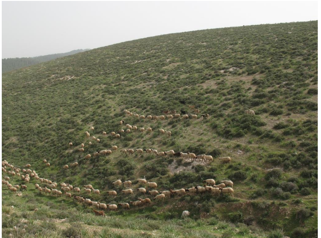
קיימת השפעה הדדית בין כמות השיחים במדבר וסוגיהם לבין רעיית הצאן. הבצורת עשויה להוביל לירידה בשטח המכוסה על-ידי שיחים

דה מלאך נ, קנדל י, פוט ה ואחרים. 2012. רעייה ובצורת בספר המדבר – מגמות ארוכות טווח בכיסוי