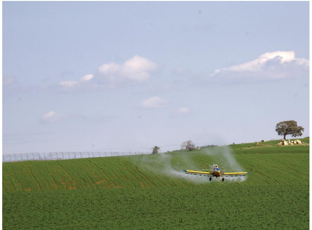
הדברה כימית מכילה תרכובות של זרחן, חנקן ואשלגן, שתוצרי הלוואי שלהם עלולים לפגוע בשכבת האוזון, במי התהום, במדבירים עצמם ואף בתוצרת החקלאית המיועדת למאכל

כפרי ד. 2012. הדברה ביולוגית – הלכה למעשה. אקולוגיה וסביבה 3(2).