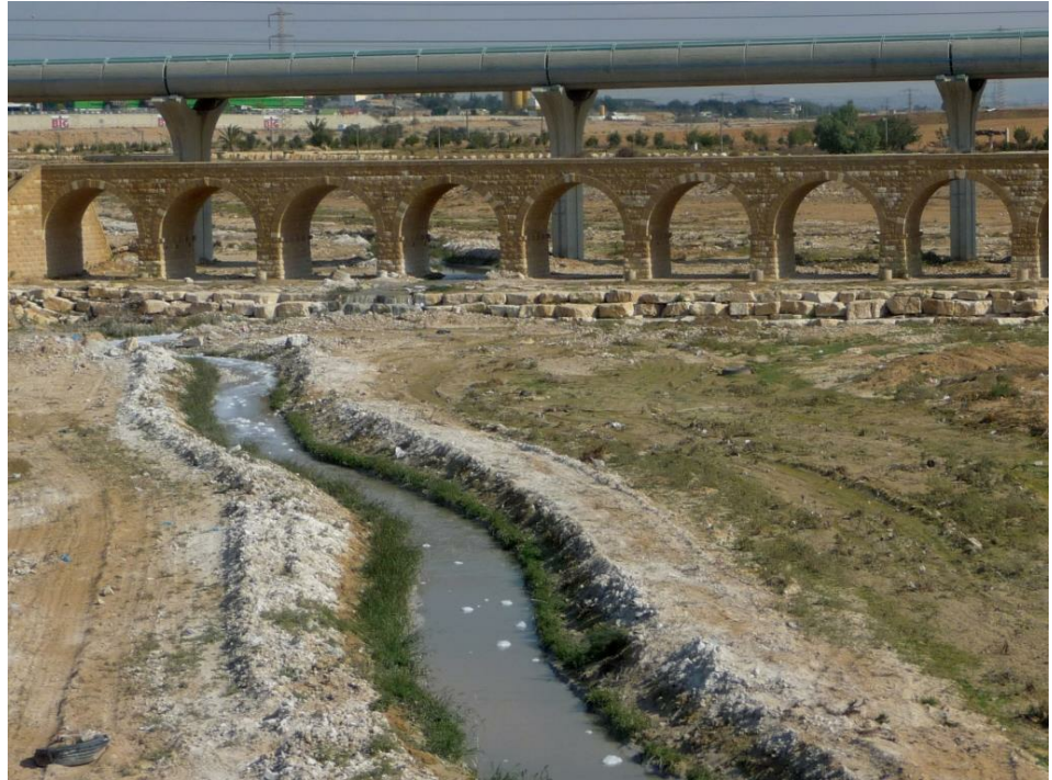
זיהום בנחל באר שבע

בין ניטור רציף (של כמות המים ואיכותם) לבין דגימה תקופתית. המידע שנאסף הוא אמצעי חיוני לניהול משאבי המים באגן ובכלל זה למילוי צורכי השקיה, להקצאת מים לטבע, להגנה מפני הצפות, למניעת נזקי סחיפה (ארוזיה) ועוד. כמו כן, מערך הניטור הוא תנאי הכרחי לצורכי פיקוח ואכיפה של תקנות מחייבות למניעת כניסת מזהמים לנחל, כגון ביוב ופסולת תעשייתית.