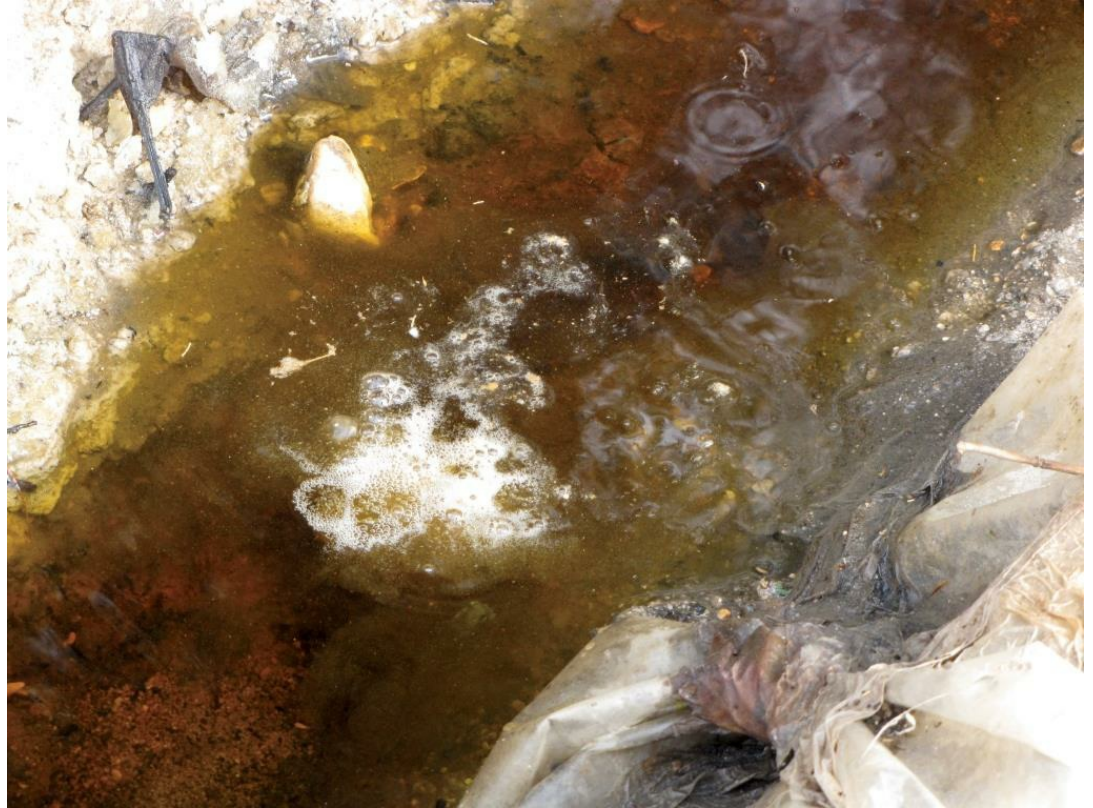
החומציות הגבוהה של חלק מהשפכים המוזרמים לנחל הבשור גורמת להמסת אבני גיר

בורנשטיין וקסלר א. 2012. ניטור זרימות עיליות באגן הבשור – מדדים והמלצות. אקולוגיה וסביבה 3(1): 18–20.