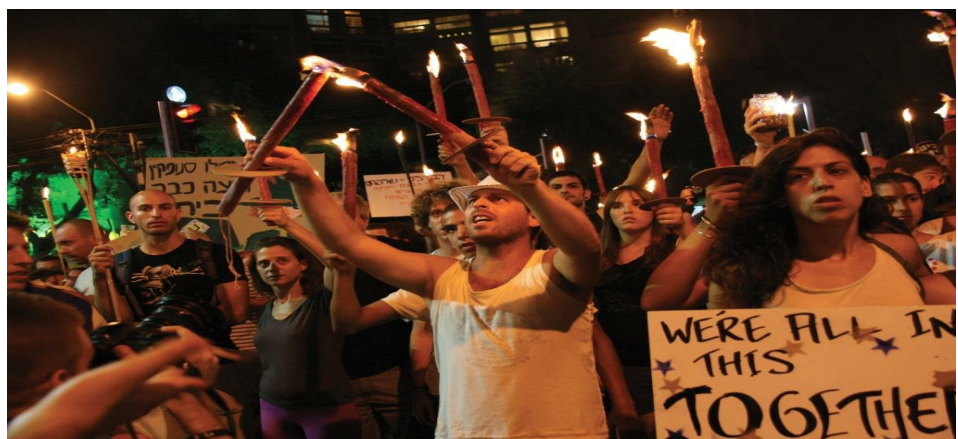
בכל הנוגע לציר הארגוני-קהילתי, ההנחה שלי היא שהרשתות שאנו מקיימים עם העולם ה"חברתי" הן רופפות ביותר. גם הניסיונות הקיימים וגם אלו מן העבר הראו לרוב משחק א-סימטרי, שבו אחד ה"צדדים" (חברתי או