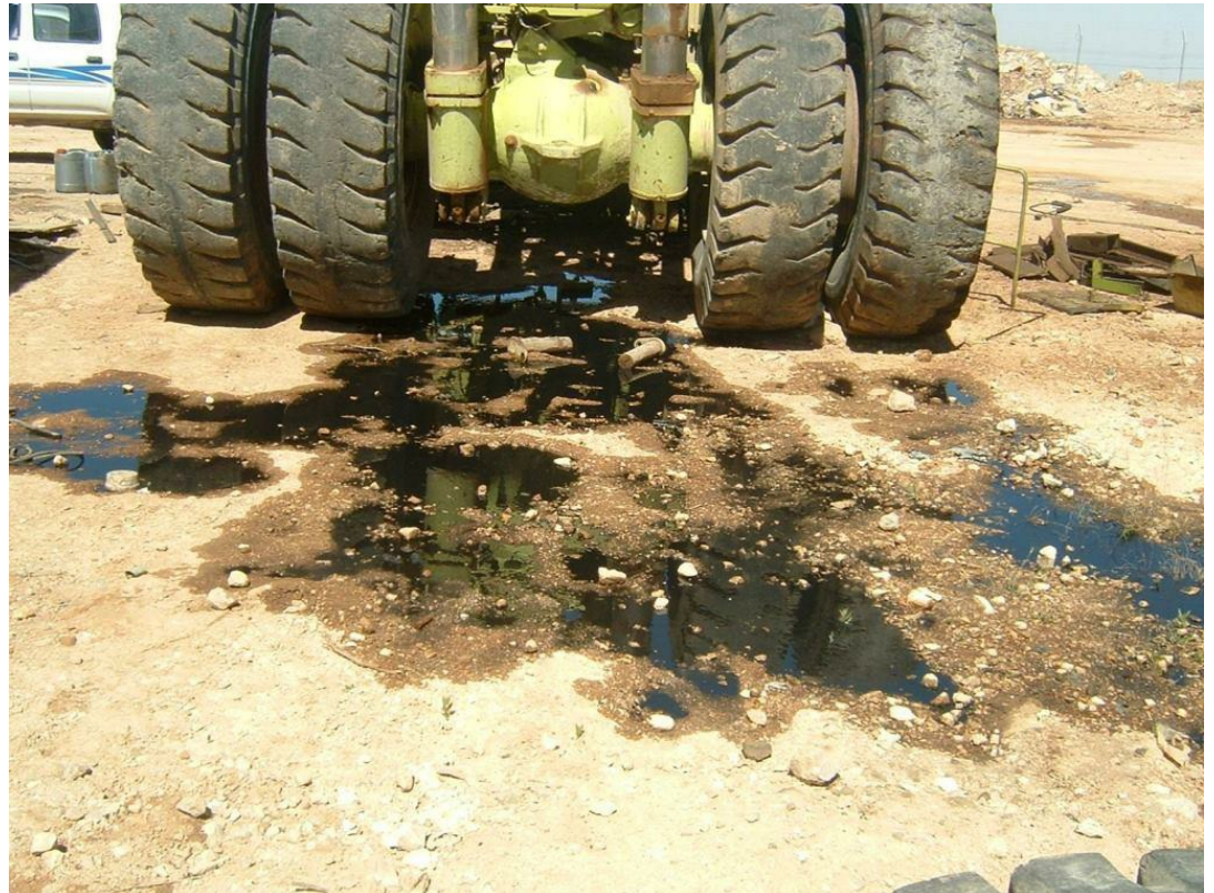
קרקע מזוהמת בפסגת זאב, ירושלים

ברחבי הארץ, ובאזורי המרכז והשרון בפרט, קיימים שטחי קרקע רבים שזוהמו בעבר על-ידי שפיכה ו/או פליטה של חומרים המסוכנים לאדם ולסביבה. זיהום זה הוא תוצר ישיר של פעילות תעשייתית המתבססת על שימוש בדלקים ובחומרים כימיים שונים.