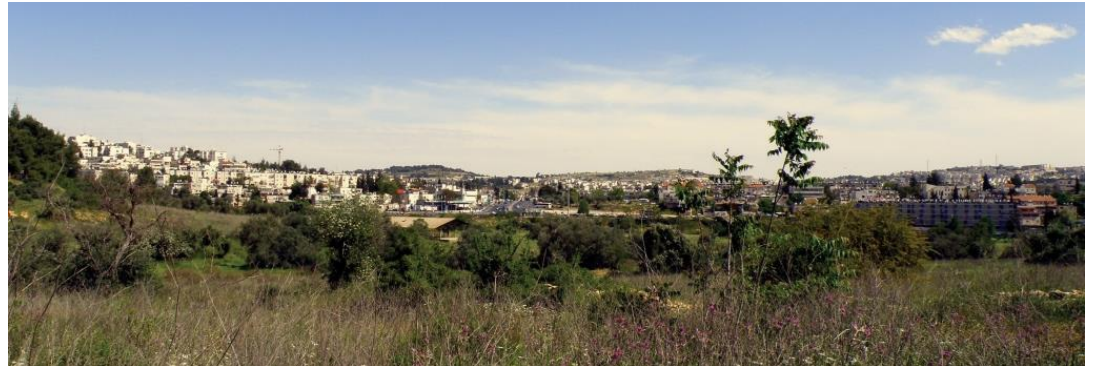
במאבק לשימור עמק הצבאים (בתמונה) בירושלים פנו ארגוני הסביבה למדענים לקבלת חוות דעת, ודחו אותה כשזו לא תאמה את סדר יומם הפוליטי

שלושת היבטים הללו באים כיום לידי ביטוי בדרכים שבהן הקהילה המדעית והסביבתית מנסות להשפיע על דעת הקהל בנוגע למצבו של כדור הארץ. בשנים האחרונות פורסמו מספר דו"חות שסיכמו קונצנזוס של אלפי מדענים. הדוגמאות הבולטות ביותר הן עבודת ה-IPCC – Intergovernmental Panel for Climate Change ועבודת צוות ה-Millennium Ecosystems Assessment [5,19] .