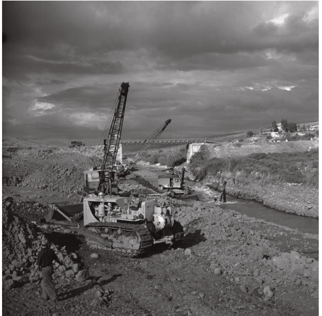
העמקת אפיק הירדן מדרום לחולה, 1952. בייבוש החולה ערערו אקולוגים על מעמד שאר המומחים המדעיים והטכנולוגיים