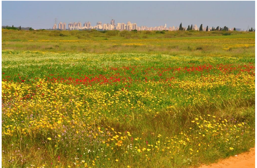
שמורת בני ציון

ספריאל א. 2011. התכנית הלאומית למגוון ביולוגי בישראל. אקולוגיה וסביבה 2(1): 9-10.